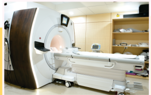
અદ્યતન 3.0 ટેસ્લા એમ આર આઇ