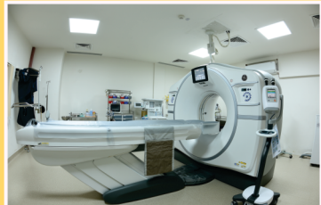
રપડ સ્લાઇસ ડ્યુઅલ એનર્જી સીટી સ્કેનર