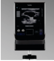
અલ્ટ્રા સાઉન્ડ મશીન

પેઇન મેનેજમેન્ટ માટેની અમારી અદ્યતન સવલતો