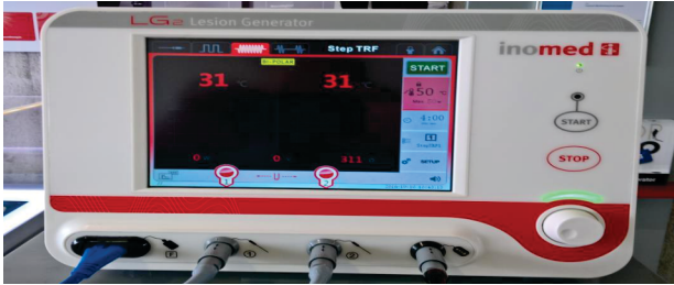
આર એફ લીઝન જનરેટર (RF/રેડિયો ફ્રીક્વન્સી)